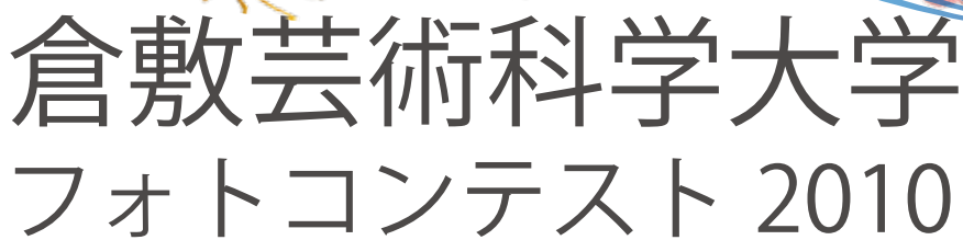
Photo contest for all high school students by Kurashiki University of Science and the Arts